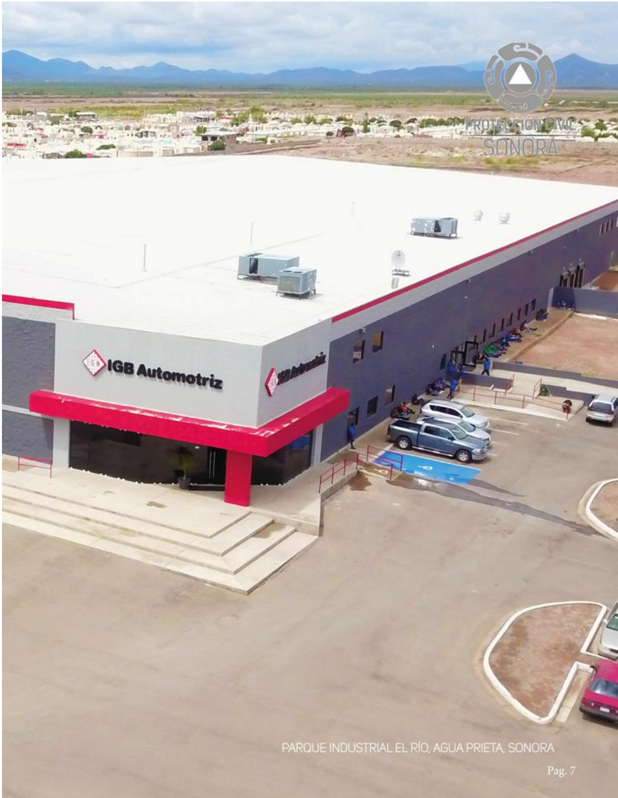
PARQUE INDUSTRIAL EL RÍO, AGUA PRIETA, SONORA