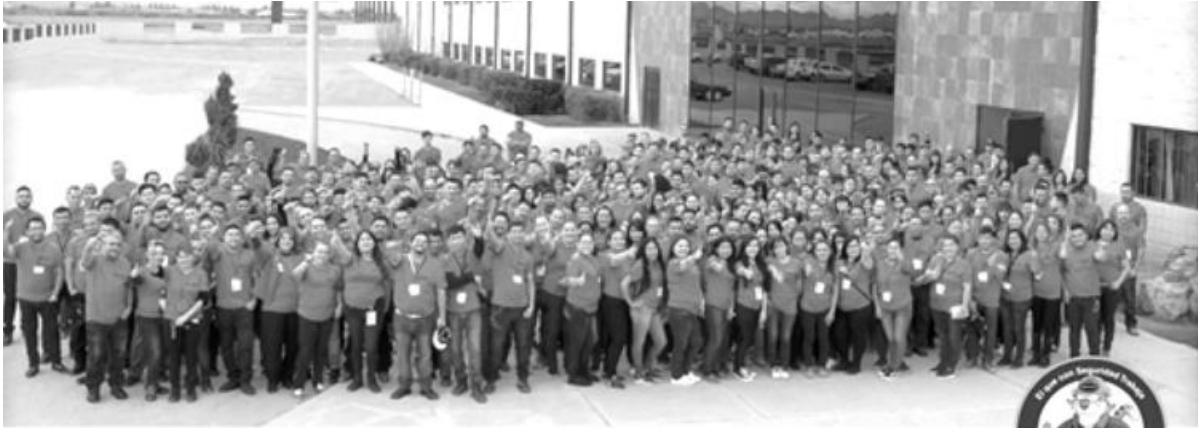
Nuestra Gente Foto antes COVID-19