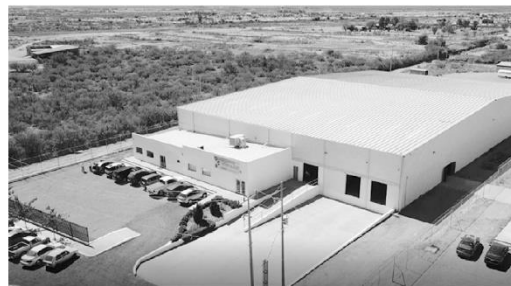
"TEMPRONICS", industria maquiladora que este mes se estableció formalmente en Agua Prieta.