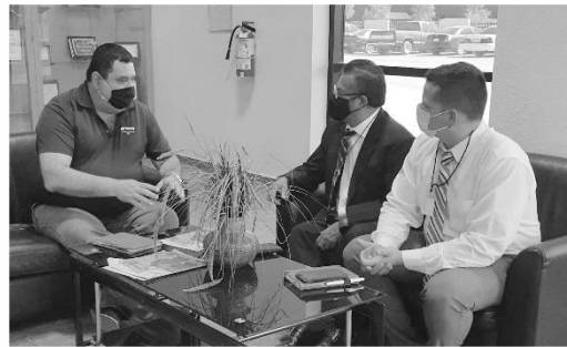
Reunión del Presidente de INDEX Agua Prieta con el Cónsul de México en Douglas, Arizona.