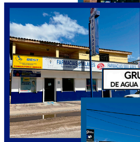
GRUPO RACAM DE AGUA PRIETA, SON S.A DE C.V