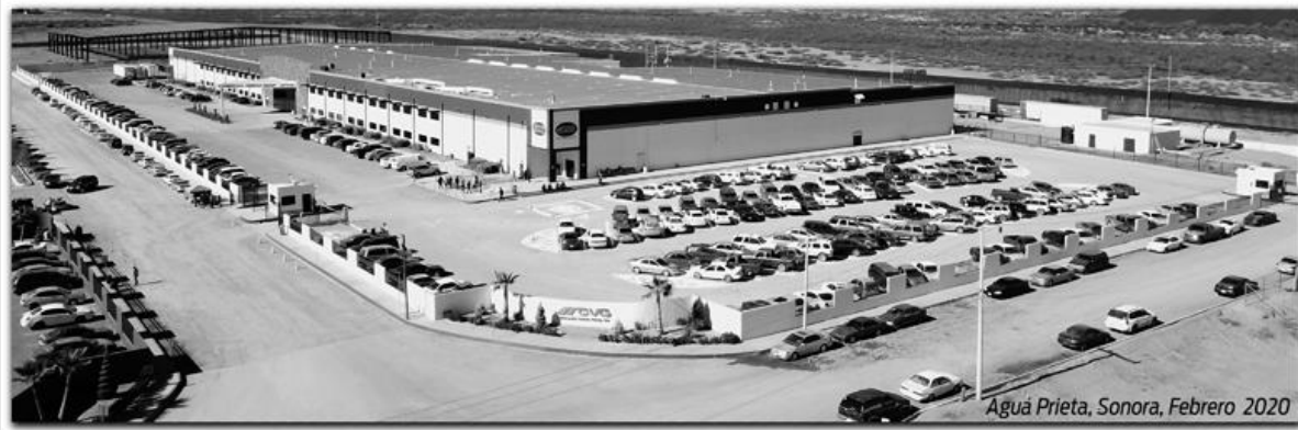
Agua Prieta, Sonora, Febrero 2020