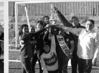
Agua Prieta, Sonora, Febrero 2020