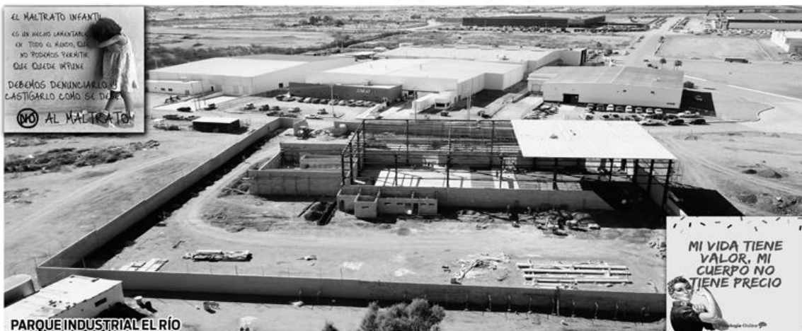
PARQUE INDUSTRIAL EL RÍO