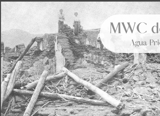
MWC de México. Agua Prieta, Sonora