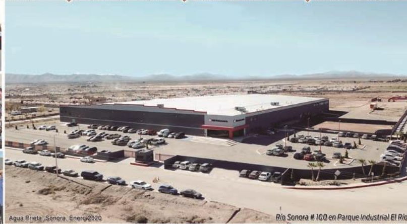
Agua Prieta, Sonora, Enero 2020