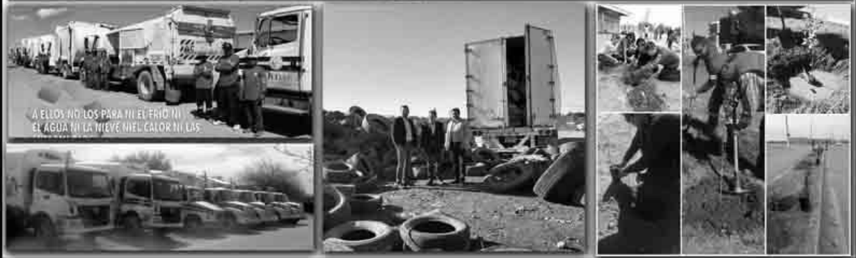
A ELLOS NO LOS PARA NI EL FRÍO NI EL AGUA NI LA NIEVE NI EL CALOR NI LAS...