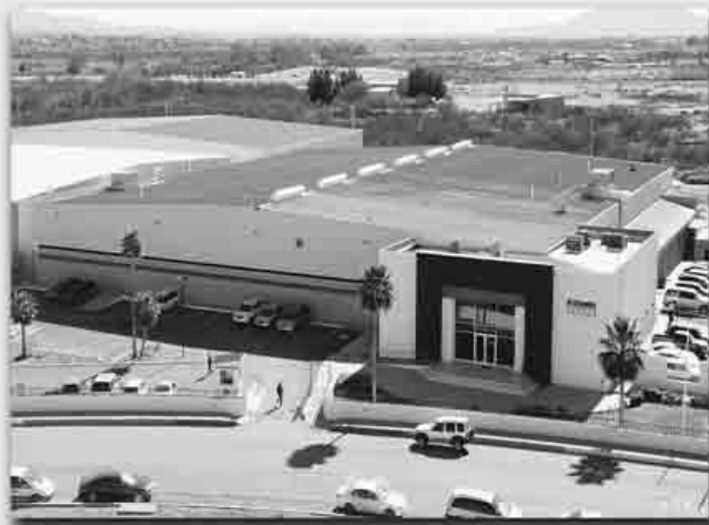
Agua Prieta, Sonora, Marzo 2020